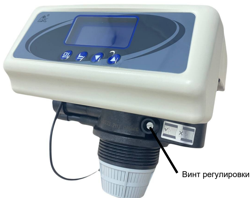
Рисунок 4 – Расположение винта регулировки остаточной жесткости