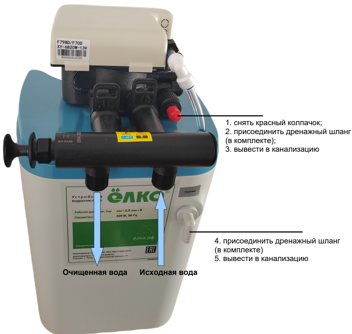
Рисунок 2 – Схема монтажа установки умягчения воды периодического действия типа “Кабинет” WSC

6.15 На рисунке 2 приведена схема монтажа установки умягчения воды.