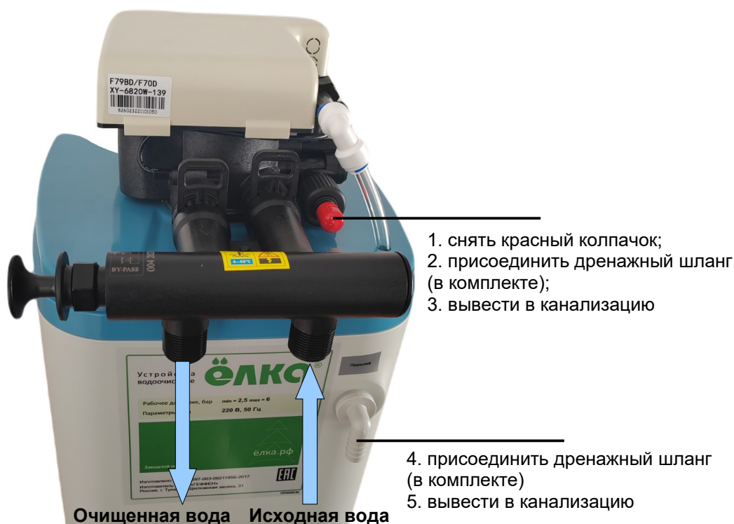
Рисунок 2 – Схема монтажа установки умягчения и обезжелезивания воды периодического действия типа “Кабинет” WSDF

6.14 На рисунке 2 приведена схема монтажа установки умягчения и обезжелезивания WSDF.