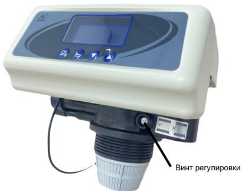
Рисунок 4 – Расположение винта регулировки остаточной жесткости