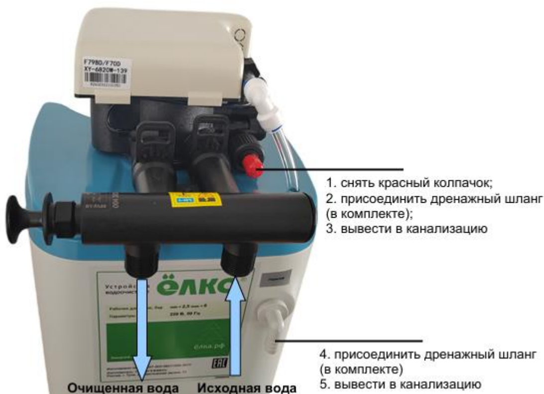
Рисунок 2 – Схема монтажа установки умягчения и обезжелезивания воды периодического действия типа «Кабинет» WSDF(C)

6.14 На рисунке 2 приведена схема монтажа установки умягчения и обезжелезивания WSDF(C)-1,3-Rx-(MIX P).