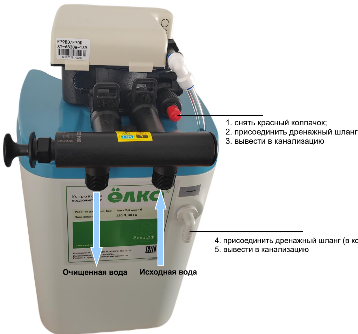
Рисунок 2 – Схема монтажа установки умягчения воды периодического действия типа “Кабинет” WSC

ЗАПРЕЩАЕТСЯ ОБЪЕДИНЯТЬ ДРУГ С ДРУГОМ ПОКАЗАННЫЕ НА СХЕМЕ ТРУБОПРОВОДЫ СБРОСА СТОЧНЫХ ВОД В КАНАЛИЗАЦИЮ.