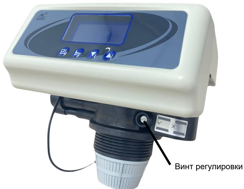
Рисунок 4 – Расположение винта регулировки остаточной жесткости